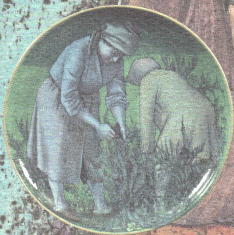
"Raccolta dei carciofi", grande coppa in maiolica policroma; ø cm 50, 1978 ca. Pesaro, collezione privata