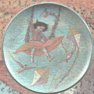
"L'altalena", coppa in maiolica policroma; ø cm 43, 1970 ca. Pesaro, collezione privata