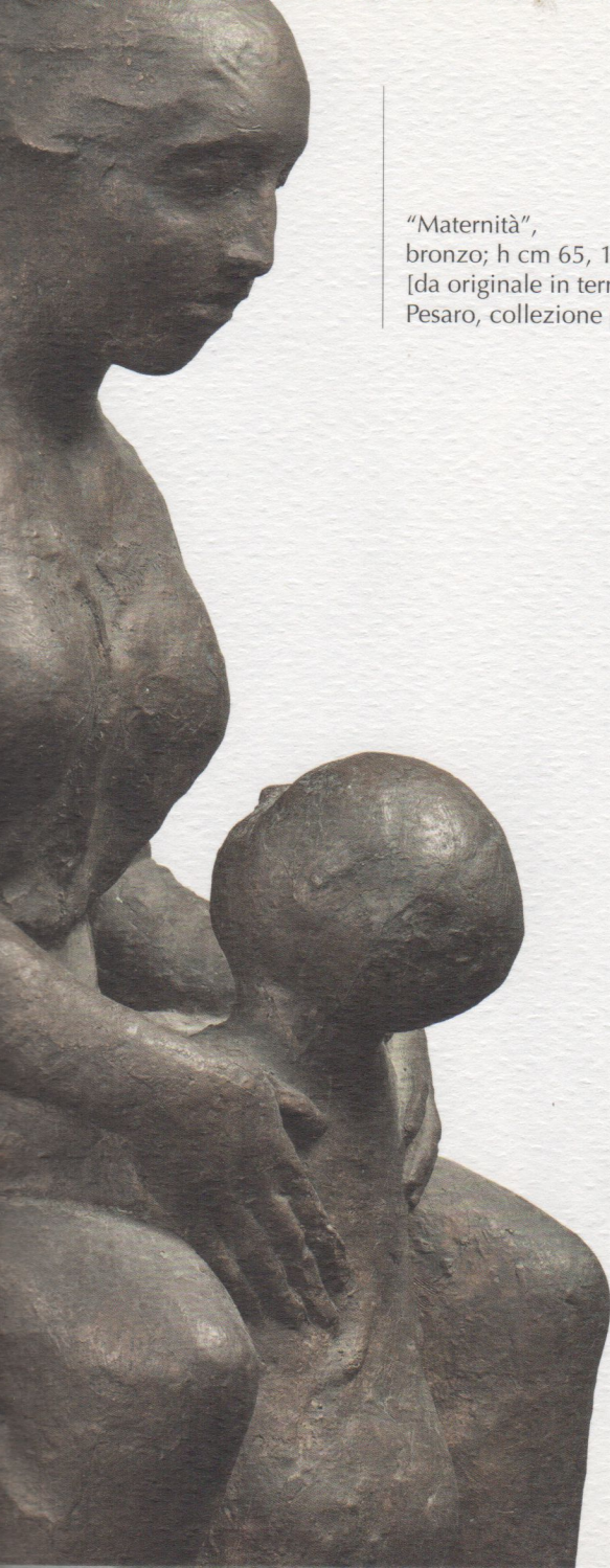
"Maternità", bronzo; h cm 65, 1980 [da originale in terracotta del 1972] Pesaro, collezione privata